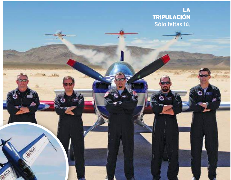
LA TRIPULACIÓN Sólo faltas tú.

El nivel de adrenalina es explosivo, pues tendrás la oportunidad de pilotear de verdad, realizar giros mortales y ver el horizonte en un giro de hasta 420 grados en segundos. Además, sentirás la aceleración sobre tu cuerpo de hasta ocho fuerzas G. El combate aéreo dura 20 minutos, pero te aseguro que serán los más emocionantes de tu vida.