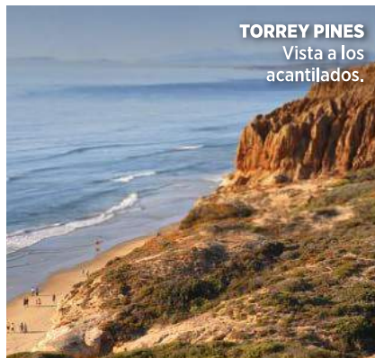
TORREY PINES Vista a los acantilados.