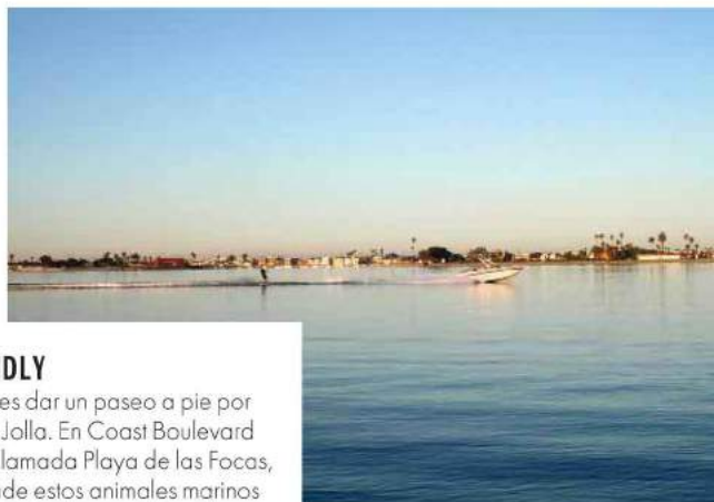
En las playas puedes practicar deportes acuáticos, como kayak con perros.