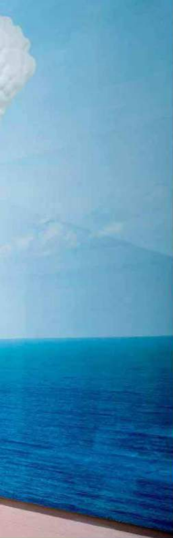
Brain/Cloud (with Seascape and Palm Tree), John Baldessari, 2011, 1250 Prospect Street.