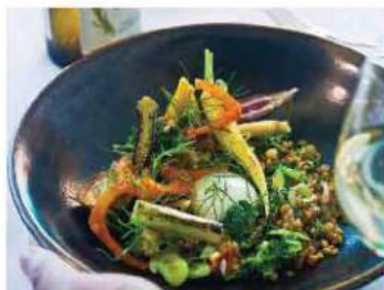
La novedad de los restaurantes en la zona de La Jolla es que ofrecen comida de autor.